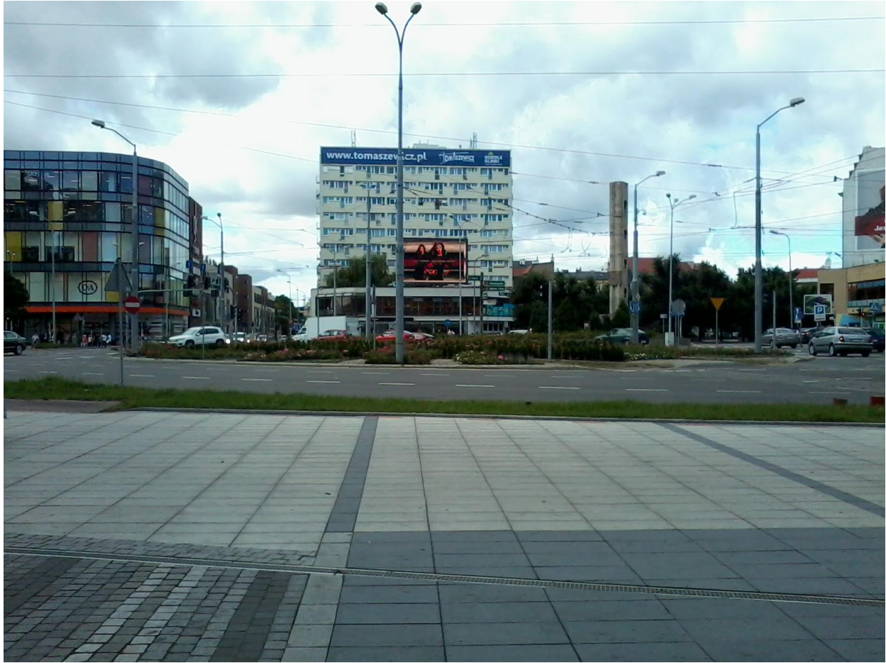
Lokalizacja nowego przejścia – widok w stronę placu Lotników