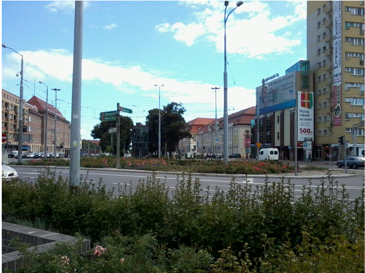
Lokalizacja nowego przejścia dla pieszych – widok w stronę alei Kwiatowej